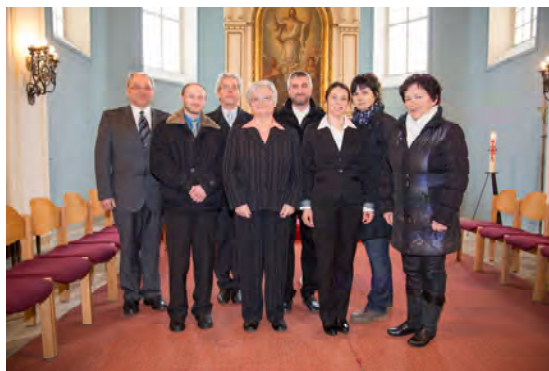
Der Kirchenvorstand im Jahr 2016