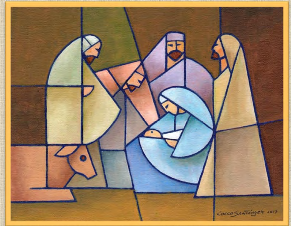
In the city of david by jorge cocco - Pinterest.de